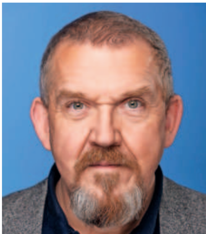
Dietmar Bär, prominenter Mime der deutschen Schauspielerszene, spricht Texte des Dichters Rainer Maria Rilke.

Dimanche – Objekttheater, Sonntag, 26. Mai, 20 Uhr, Festhalle Viersen, Abonnement Studio, Einzelkarten 17 Euro. Weiterer Termin für Kinder am Montag, 27. Mai, 10 Uhr, Festhalle Viersen, Label „Vierfalt.Kids“