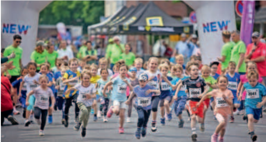
Kinder absolvieren mit Lauffreude die Strecken im Stadtteil Rahser..