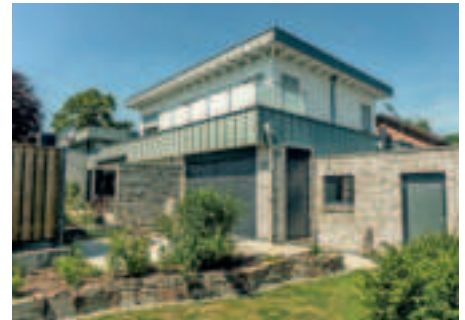
Haus, Anbau oder Aufstockung – mit dem Holzrahmenbau werden den Möglichkeiten keine Grenzen gesetzt.