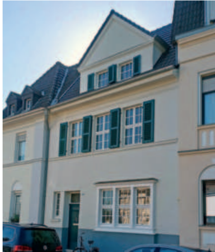
Dieses Wohnhaus an der Merianstraße in Süchteln ist 1913 erbaut worden.

Die Aufteilung der Zimmer ist im Wesentlichen unverändert erhalten. Der seitliche schmale Flur – mit teilweise erhaltenem Terrazzoboden – erschließt Wohn- und Esszimmer des Erdgeschosses und führt an der Treppe vorbei zur rückwärtigen Küche. Die originale Holzterrasse ist ebenso erhalten wie die ursprünglichen Zimmertüren mit verschiedenen unterteilten Fenstereinsätzen, die Dielen-