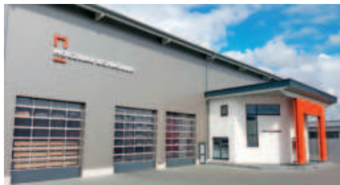
Die Produktionshalle von Holzbau Schröder in Niederkrüchten.

Es können jederzeit Termine für eine kostenlose und unverbindliche Beratung vereinbart werden.