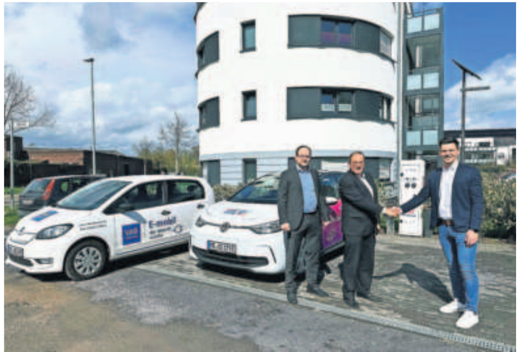
Partnerschaft für emissionsfreie Mobilität. Die ersten E-Ladesäulen für Mieter an den VAB-Neubauten Brüsseler Allee und Körnerhöfe.

NEW betreibt, VAB fördert Die Ladesäulen werden von der NEW aufgestellt und betrieben. Die VAB stellt die Ladeplätze auf ihren Grundstücken bereit und macht den Betrieb durch eine Förderung möglich. Nur so wurde das Versorgungskonzept möglich. Wer als Mieter Interesse hat, kann einen Versorgungsvertrag mit der NEW ab-