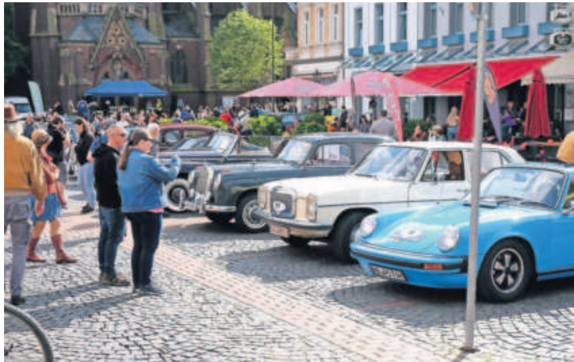
Am Samstag, 25. Mai, startet die nächste Viersener Oldtimer-Rallye mit rund 140 Fahrzeugen. Unser Foto von 2023 zeigt bestaunte Oldtimer auf dem Alten Markt in Dülken. Diesmal ist Rallye-Start auf dem Remigiusplatz in Viersen und Zielankunft auf dem Lindenplatz in Süchteln.

Organisiert wird die Ausfahrt von einem Arbeitskreis engagierter Menschen aus dem Citymanagement der Stadt Viersen, dem Motorsportclub Süchteln und der Volksbank Viersen. Die Stadt Viersen veranstaltet das Event, Hauptsponsor ist die Volksbank Viersen. Der Motorsportclub Viersen bringt seine Expertise unter anderem bei der Planung der Streckenführung ein. Die Route führt von Viersen aus über Anrath, Kempen und Lobberich nach Boisheim, wo die Mittagspause stattfinden wird. Anschließend geht es weiter über Wegberg, Mönchengladbach