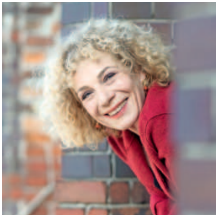
Schauspielerin Nina Hoger schaut am 24. Mai in der Vierseiner Festhalle vorbei und liest Rilke-Texte vor.