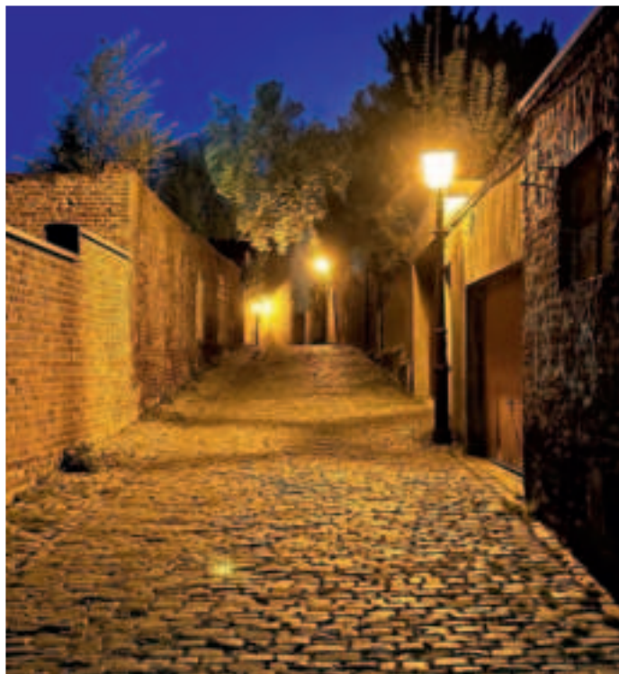
Die nächtliche Stimmung der Dülkener Altstadt ist wie gemacht für ein Nachtwächter- und Türmerzunft-Treffen.

Die Ausrichtung der Feierlichkeiten für das 39. Treffen der Nachtwächter- und Türmerzunft an Christi Himmelfahrt wird finanziell unterstützt. Hauptsponsor ist die Viersener Sparkassenstiftung, weiterer Sponsorpartner ist die Volksbank Viersen.