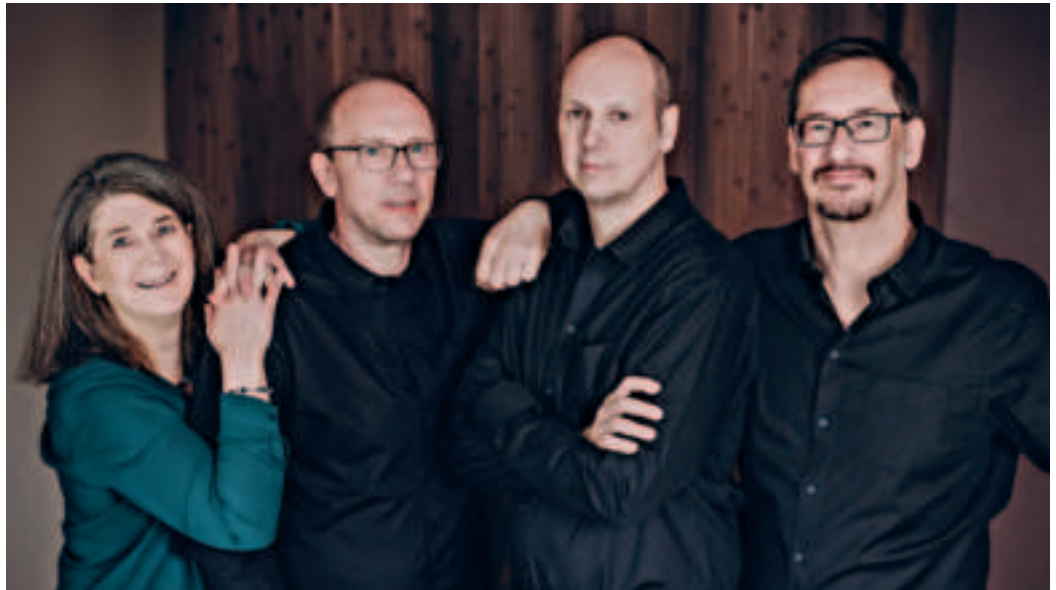
Das Team von Elektro Mainz feiert 50-jähriges Bestehen.

In den letzten 50 Jahren haben wir viele Entwicklungen kommen und gehen sehen, und haben viele Menschen dabei begleitet, ein sicheres