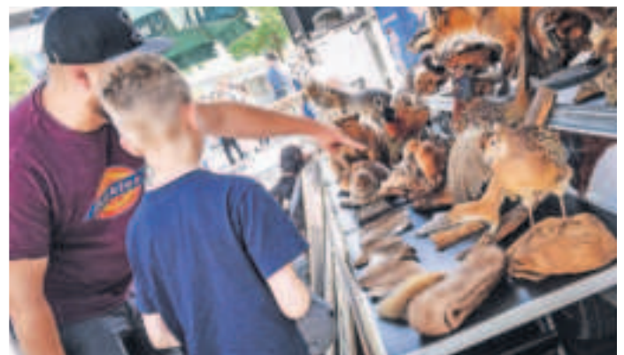
Die „Rollende Waldschule“ der Kreisjägerschaft bringt Kindern und Erwachsenen Natur und heimische Tierarten näher.

Organisiert wird der „Stadt.LandMarkt.Viersen“ 2024 vom Team des städtischen Citymanagements. Die Sponsoren der Sonntagsveranstaltung sind die EGN und EA Elektroautomatik.