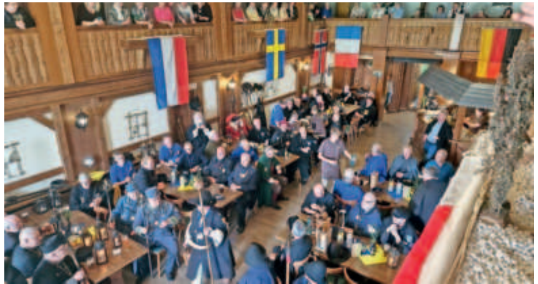
In Zwönitz trafen sich alle Zunftmitglieder im dortigen Ratssaal.